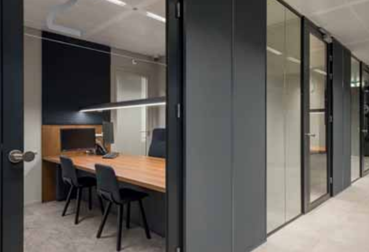
FOTO LINKSBOVEN Balie op de eerste verdieping.