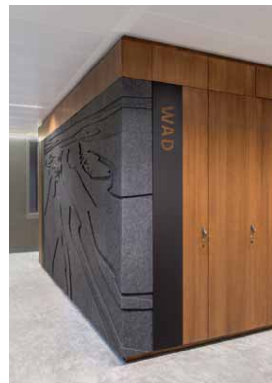
FOTO LINKSBOVEN Vergadercentrum.