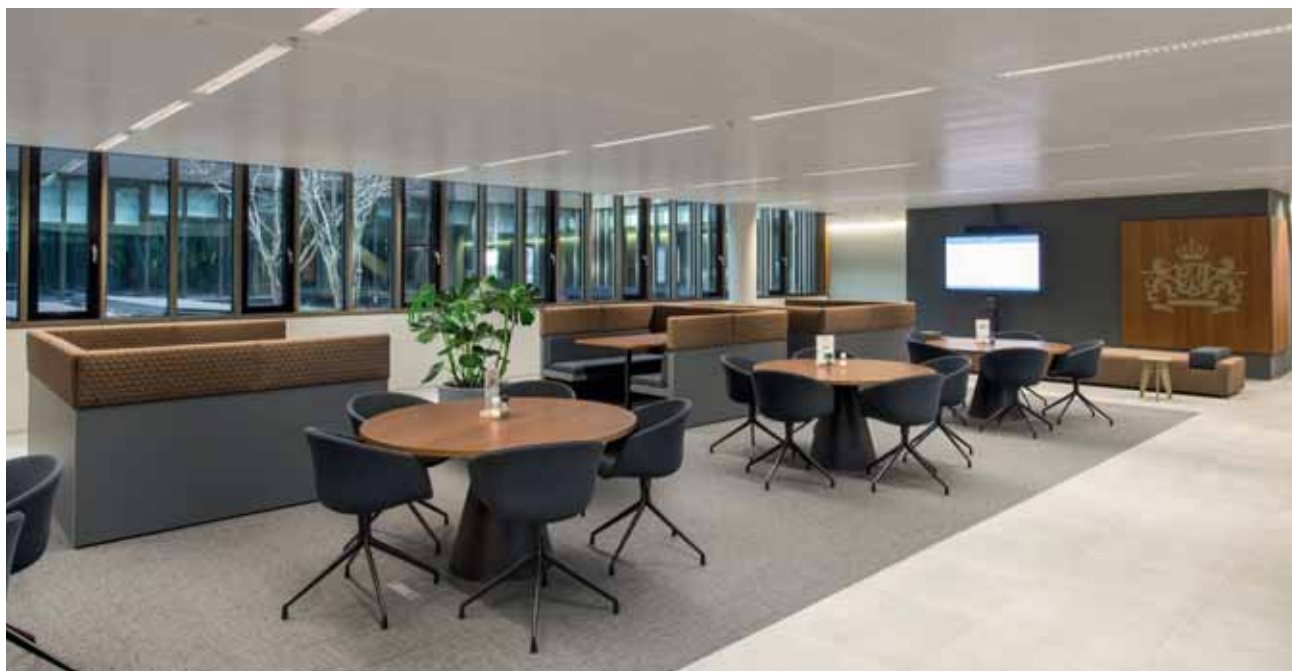
FOTO LINKS Het werkcafé in de vide.

Het nieuwe kantoor zou moeten worden ingericht volgens de principes van het nieuwe werken, zoals die voor de Rijksoverheid zijn vastgelegd in FWR (Fysieke Werkomgeving Rijk). Het gebouw had echter de structuur van een bedrijfsverzamelgebouw – met verschillende kantoorunits aan een lange, smalle gesloten gang – dat een beletsel vormde voor het creëren van een open kantooromgeving gericht op verbinding, ontmoeting en contact. Ook waren er in het casco weinig verbindingen tussen de verdiepingen en maar op één plek liften.